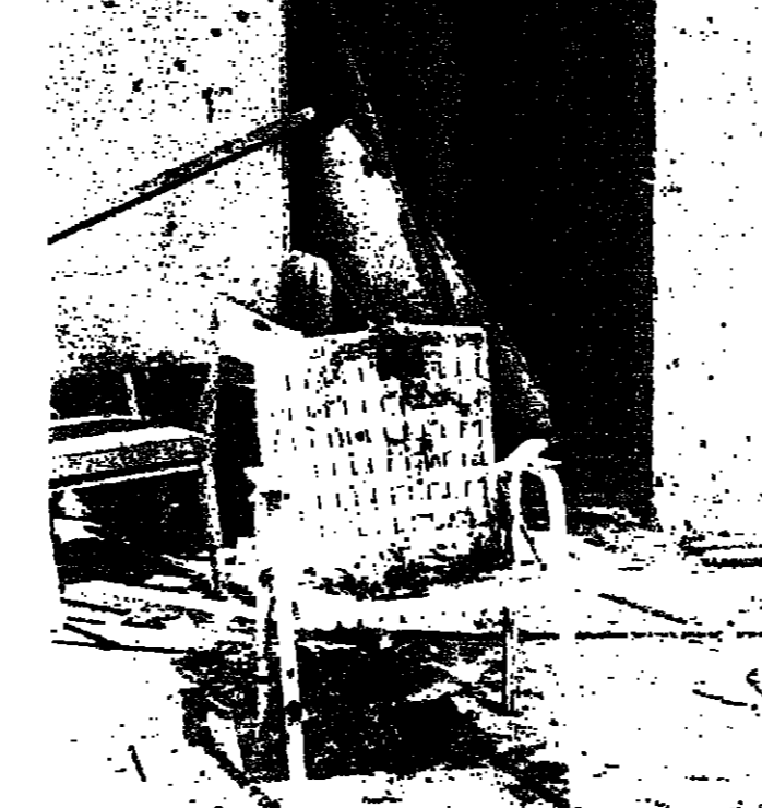
انار الغمام على كورسي كسان يجلس عليه احد الضباط الاربعة الذين استشهدوا في تلك الصور